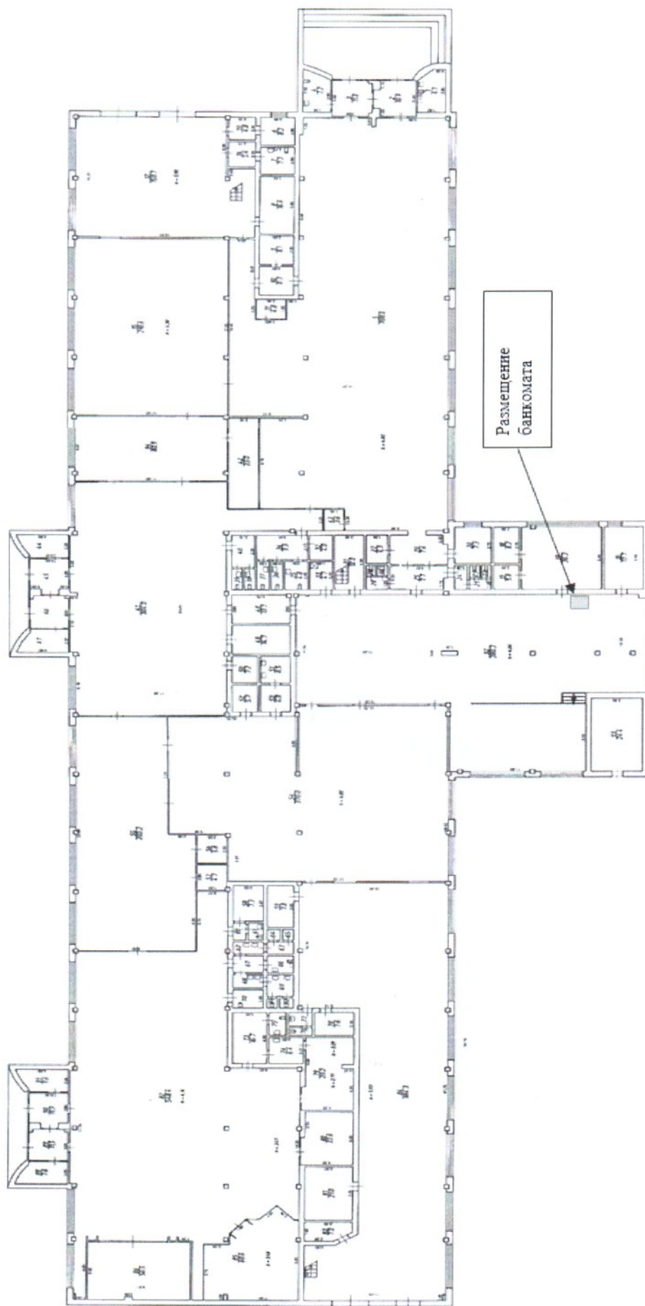
Схема международного аэровокзала, 1 этаж